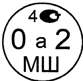
Рисунок 4.1. Знак поверки государственного регионального центра метрологии