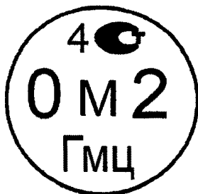
Рисунок 4.2. Знак поверки государственного научного метрологического института